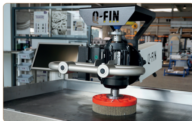
Arrondi des bords avec la brosse à disque ø255 mm en option.

Les dimensions de la surface de travail sont de 1280 x 780 mm (L x P). Cependant, il n'y a pas de longueur maximale pour les pièces à travailler car vous pouvez facilement rabattre les panneaux latéraux. Le panneau frontal peut être également rabattu pour travailler sur des produits plus larges. C'est une machine pour l'ébavurage et l'arrondi des bords en toute sécurité à un prix attractif. Visitez Q-Fin et faites le test vous-même.