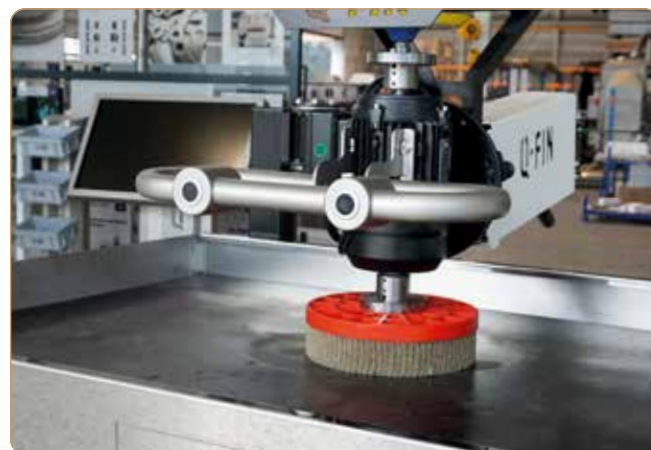
ProGrinder: Kantenverrunden mit der optionaler Tellerbürste.

Die Abmessungen der Arbeitsfläche sind 1280 x 780 mm. Die maximale Tiefe für ein Arbeitsstück beträgt somit 780 mm. Die Länge ist dabei uneingeschränkt, und breitere Produkte sind ebenfalls möglich da die Seiten und Vorderseite vom Tisch einfach umgelegt werden können.